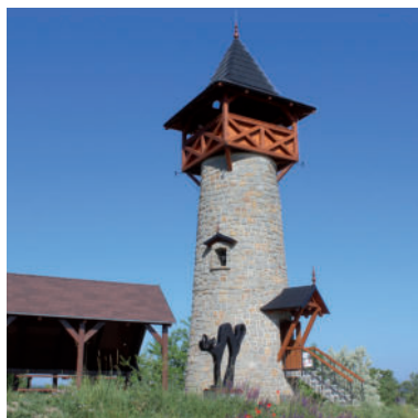
Rozhľadňa na Hrebni.