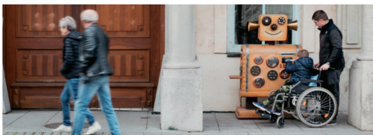
Dobrostroj zbiera nápady na dobré skutky.

Hlas Dobrostroju prepožičal herec Braňo Mosný.