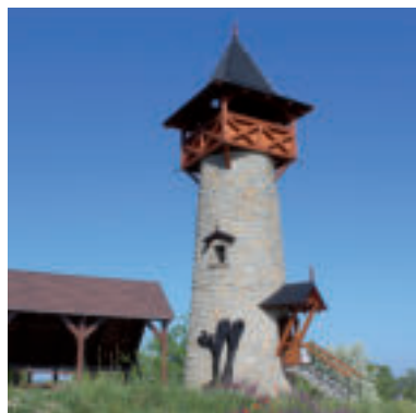
Rozhľadňa na Hrebni.