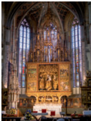
Dielo majstra Pavla - hlavný oltár.

Mesto Levoča disponuje všetkými mestskými atribútmi slobodného kráľov-