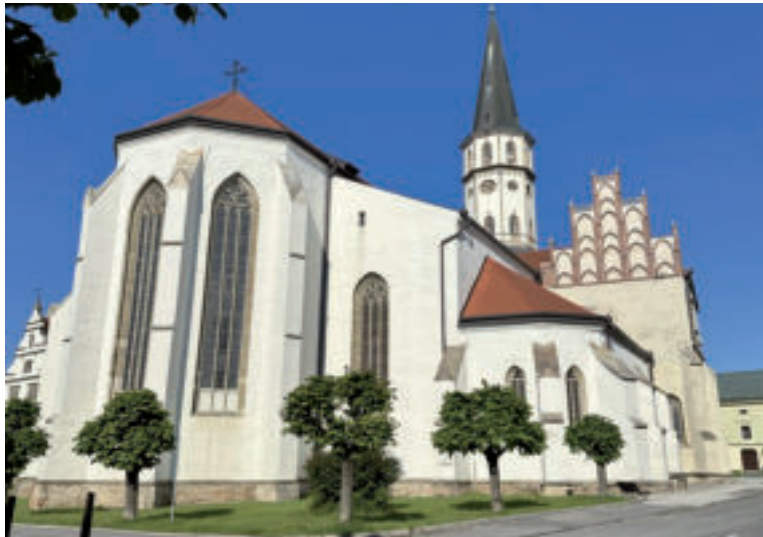
Bazilika sv. Jakuba.

Pôvod levočskej radnice siaha do 15. storočia. Pôvodná drevená budova radnice bola zničená v roku 1550 požiarom, v roku 1599 ju požiar postihol opäť. V roku 1615 ju rozšírili a pribudovali južnú časť a arkády