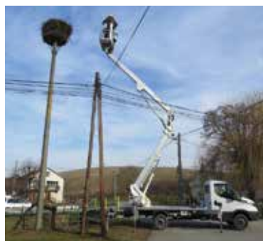
» ren zdroj foto ŠOP SR

Informácie poskytol Odbor komunikácie a propagácie ŠOP SR