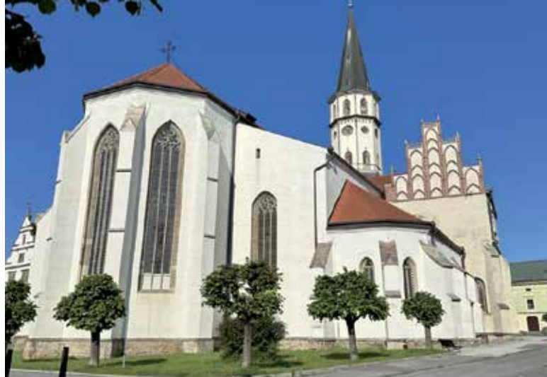
Bazilika sv. Jakuba.

Pôvod levočskej radnice siaha do 15. storočia. Pôvodná drevená budova radnice bola zničená v roku 1550 požiarom, v roku 1599 ju požiar postihol opäť. V roku 1615 ju rozšírili a prístavbovali južnú časť a arkády