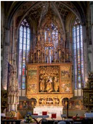
Dielo majstra Pavla - hlavný oltár.

Mesto Levoča disponuje všetkými mestskými atribútmi slobodného kráľov-