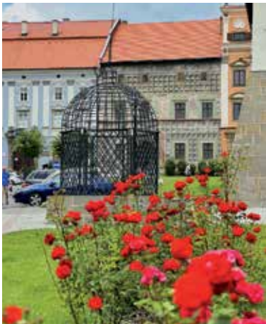
Klietka hanby.

ského mesta. Nájdeme tam silné opevnenie, priestrané pravouhlé námestie ako centrum verejného života s významným farským kostolom a radnicou vo svojom strede a mnohými reprezentačnými meštianskymi domami s vnútornými dvormi a arkádami po obvode námestia Majstra Pavla. Kostoly a veľká časť mesta si zachovali svoj pôvodný ráz. Vzhľadom na výnimočné historické a kultúrne hodnoty bolo historické jadro Levoče v roku 1950 vyhlásené za mestskú pamiatkovú rezerváciu a pre svoje architektonické hodnoty bola Levoča spolu s Dielom Majstra Pavla zapísaná v roku 2009 do Zoznamu svetového kultúrneho dedičstva UNESCO.