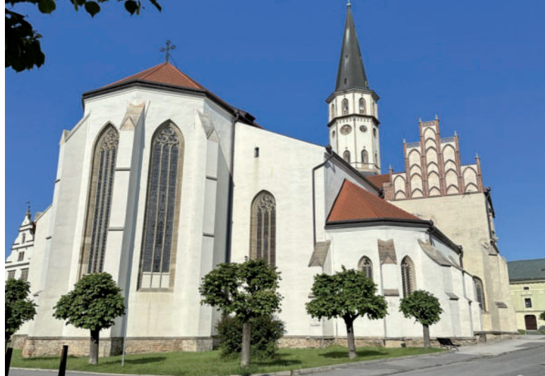
Bazilika sv. Jakuba.

Pôvod levočskej radnice siaha do 15. storočia. Pôvodná drevená budova radnice bola zničená v roku 1550 požiarom, v roku 1599 ju požiar postihol opäť. V roku 1615 ju rozšírili a prístavbovali južnú časť a arkády