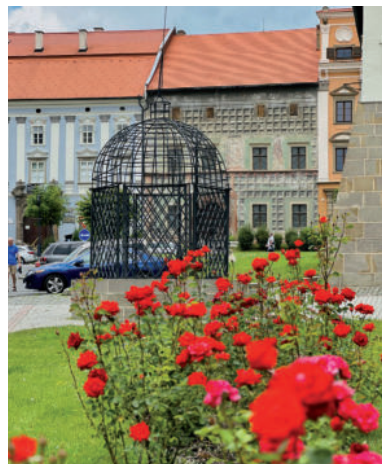
Klietka hanby.

ského mesta. Nájdeme tam silné opevnenie, priestrané pravouhlé námestie ako centrum verejného života s významným farským kostolom a radnicou vo svojom strede a mnohými reprezentačnými meštianskymi domami s vnútornými dvormi a arkádami po obvode námestia Majstra Pavla. Kostoly a veľká časť mesta si zachovali svoj pôvodný ráz. Vzhľadom na výnimočné historické a kultúrne hodnoty bolo historické jadro Levoče v roku 1950 vyhlásené za mestskú pamiatkovú rezerváciu a pre svoje architektonické hodnoty bola Levoča spolu s Dielom Majstra Pavla zapísaná v roku 2009 do Zoznamu svetového kultúrneho dedičstva UNESCO.