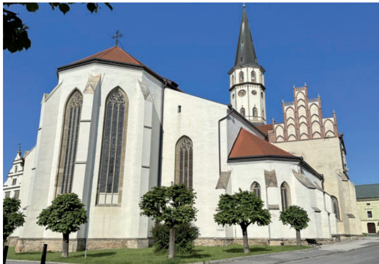
Bazilika sv. Jakuba.

Pôvod levočskej radnice siaha do 15. storočia. Pôvodná drevená budova radnice bola zničená v roku 1550 požiarom, v roku 1599 ju požiar postihol opäť. V roku 1615 ju rozšírili a prístavbovali južnú časť a arkády