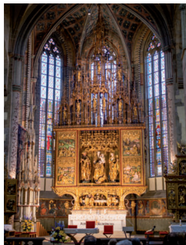
Dielo majstra Pavla - hlavný oltár.

Pochádza zo 16. storočia, stojí na pevnom základe a je zdobená kovanými srdcami a laliami – symbolmi nevinnosti a lásky. Klietka slúžila nielen na vystavenie obvineného verejnej potupe, ale zároveň i ako výstraha pre ostatných. Na potrestaných mohla verejnosť aj plúť. Trest sa často vykonával počas jarmokov, kedy bolo na námestí veľké množstvo ľudí. Klietka hanby stála pôvodne na mieste dnešného evanjelického kostola. Neskôr stála v parku rodiny Probstnerovcov, v priestore dnešnej nemoc-