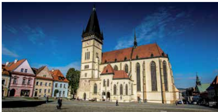
Bazilika minor Sv. Egídia.

Medzi Kláštornou baštou a Hornou bránou, v záhrade starej nemocnice, stojí lampový stĺp. V stredoveku slúžili lampové stĺpy ako orientačné body, preto sa stavali najmä na križovatkách, cintorínoch a na pamätných miestach. Vo vežovitej časti stĺpu horelo svetlo, ktoré plnilo funkciu orientačnú, ale aj spomienkovú. Bardejov-