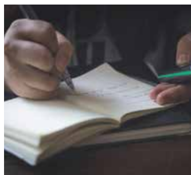
Ilustračné foto.