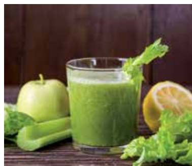
Ilustračné foto.