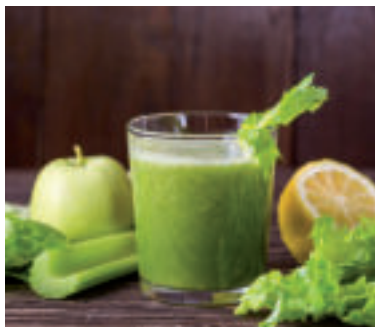
Ilustračné foto.