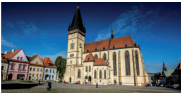
Bazilika minor Sv. Egídia.

Medzi Kláštorňou baštou a Hornou bránou, v záhrade starej nemocnice, stojí lampový stĺp. V stredoveku slúžili lampové stĺpy ako orientačné body, preto sa stavali najmä na križovatkách, cintorínoch a na pamätných miestach. Vo vežovitej časti stĺpu horelo svetlo, ktoré plnilo funkciu orientačnú, ale aj spomienkovú. Bardejov-