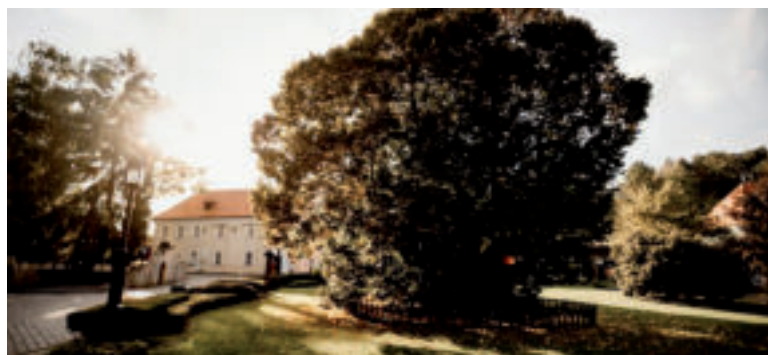
Lipa kráľa Mateja.

Bojnický zámok je jedným z 25 najkrajších európskych hradov a zámkov. Vypína sa na travertínovej kope, ktorú