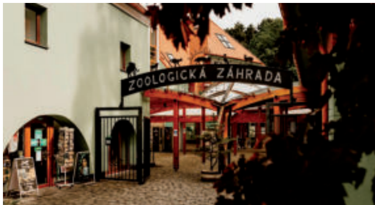
Národná ZOO Bojnice.

Ak sa vám zažiada, poprechádzať sa zámockým parkom, isto si urobte zastávku