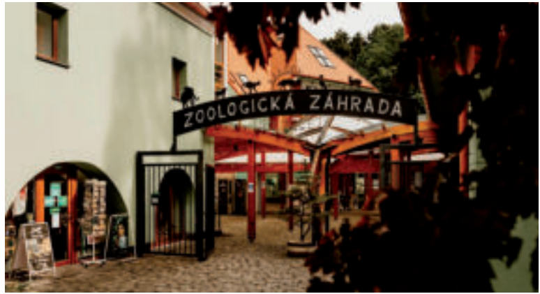
Národná ZOO Bojnice.

Ak sa vám zažiada, poprechádzať sa zámockým parkom, isto si urobte zastávku