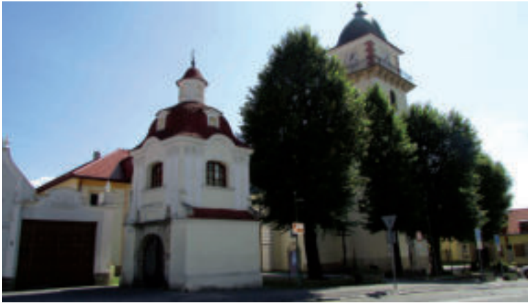
Kostol sv. Martina biskupa z Tours.

Budovu kostola sv. Martina biskupa z Tours môžu záujemcovia vidieť v centre