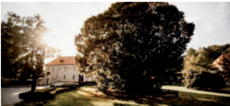
Lipa kráľa Mateja.

Bojnický zámok je jedným z 25 najkrajších európskych hradov a zámkov. Vypína sa na travertínovej kope, ktorú