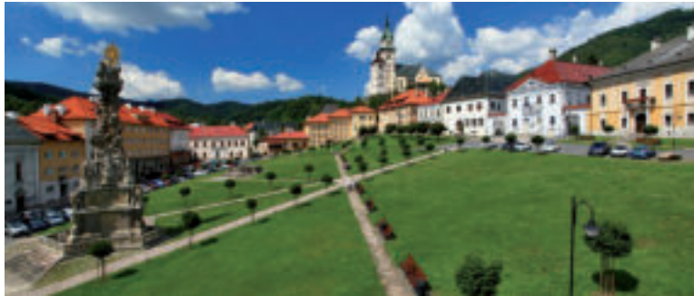
Morový stĺp.

Banická bašta , stojaca neďaleko karniera a severnej veže je pôvodne polkruhová bašta opevnenia. V 2. pol. 15. stor. nad ňu