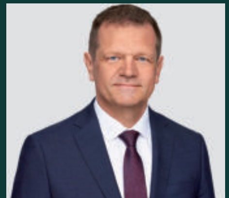
Peter Kmec podpredseda vlády Slovenskej republiky pre Plán obnovy a znalostnú ekonomiku

S podielom 54 % vyplatených zdrojov sme sa tak zaradil na piate miesto v EÚ a na prvé miesto vo V4.“