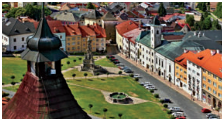
Štefánikovo námestie.

Kremnica je najčastejšie spájaná s prívlastkom zlatá. Výraznú stopu ľudskej činnosti v blízkom okolí predstavujú najstaršie banské štôlna a šachty, ktorých vznik kladú niektorí odborníci do 8. až 9. stor. Údolie Kremnického potoka bolo banícky aj poľnohospodársky kolonizované slovenským a nemeckým obyvateľstvom