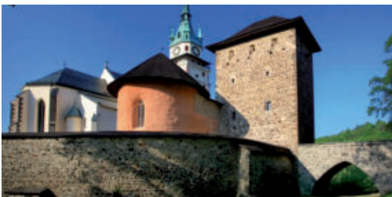
Mestský hrad.

Južná veža , tzv. farská, spája vstupným schodiškom hrad s mestom. Jednopriestorová hranolová stavba vznikla v 2. pol. 14. stor. a do 15. stor. v nej sídlila fara. Po r. 1780 k nej pristavili kryté schodiško. Koncom 19. stor. umiestnili na poschodí zvony. Dnes slúži ako vstup do expozíčných priestorov hradu.