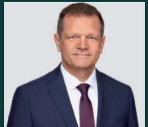
Peter Kmec podpredseda vlády Slovenskej republiky pre Plán obnovy a znalostnú ekonomiku

S podielom 54 % vyplatených zdrojov sme sa tak zaradil na piate miesto v EÚ a na prvé miesto vo V4.“