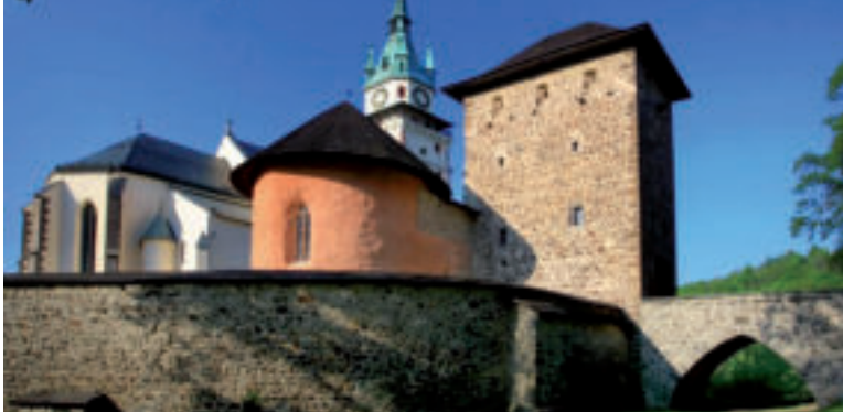
Mestský hrad. zdroj foto Kultúrne a informačné centrum mesta Kremnica

Horový stĺp. zdroj foto Kultúrne a informačné centrum mesta Kremnica Horový stĺp. zdroj foto Kultúrne a informačné centrum mesta Kremnica Horový stĺp. zdroj foto Kultúrne a informačné centrum mesta Kremnica