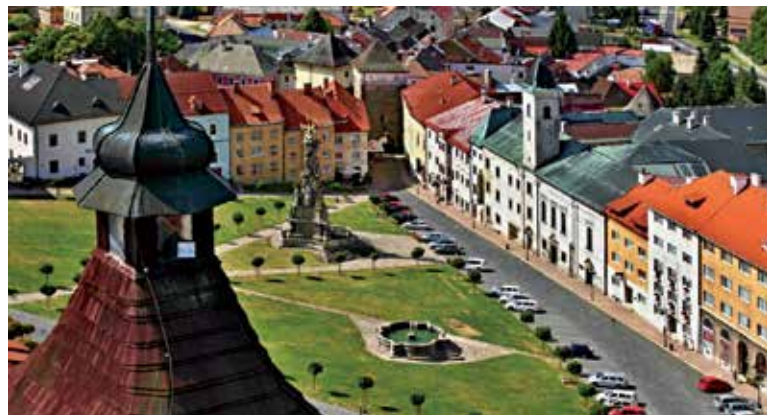
Štefánikovo námestie.

Objekty mincovne v opevnenom meste sú postavené na mieste niekoľkých starších meštianskych domov. Súbor zachovaných výrobných, administratívnych a obytných budov je výsledkom zložitých stavebných premien od 15. stor. podnes. Kremnická mincovňa sa spolu s budín-