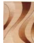
KOBEREC CHEAP K857A BÉŽOVÝ