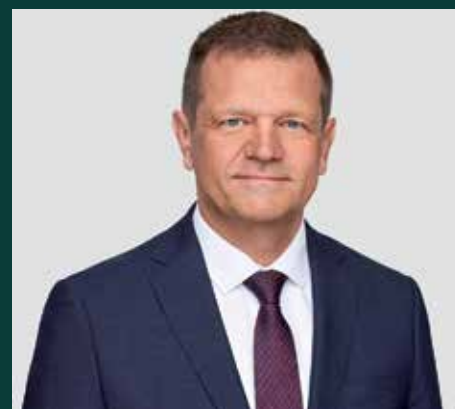
Peter Kmec podpredseda vlády Slovenskej republiky pre Plán obnovy a znalostnú ekonomiku

S podielom 54 % vyplatených zdrojov sme sa tak zaradil na piate miesto v EÚ a na prvé miesto vo V4.“