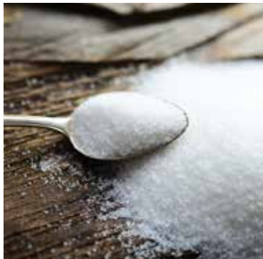
» ren zdroj foto congerdesign pixabay

„Dôležité je vedieť, že aj malá zmena sa počíta. Začnite si budovať zdravý vzťah k cukru hneď teraz,“ uzatvárajú výpočet rád na sociálnej sieti odborníci z ÚVZ SR.