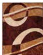
KOBEREC 4959B CHEAP HNEDÁ