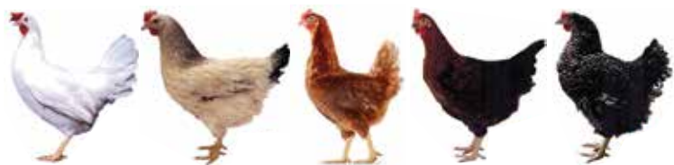
Dekalb White ISA Sussex Bovans Brown Moravia BSL Moravia Barred

Miesto predaja: Krupina, farma Bebrava (smer na priehradu)