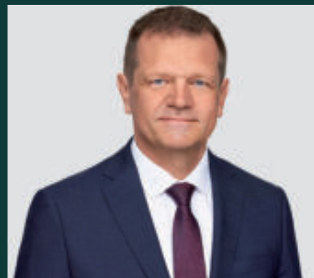
Peter Kmec podpredseda vlády Slovenskej republiky pre Plán obnovy a znalostnú ekonomiku

S podielom 54 % vyplatených zdrojov sme sa tak zaradil na piate miesto v EÚ a na prvé miesto vo V4.“