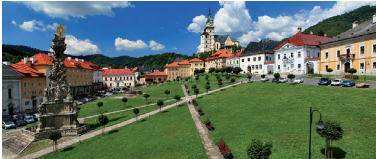
Morový stĺp.

nadmurovali polygón, ktorý tvoril presbytérium Kaplnky Narodenia Panny Márie. K polygónu sa pripájala krátka obdĺžniková loď, ktorej základy odkryl archeologický výskum. Zanikla pravdepodobne ešte v 16. stor., kedy objekt znovu upravili na baštu.