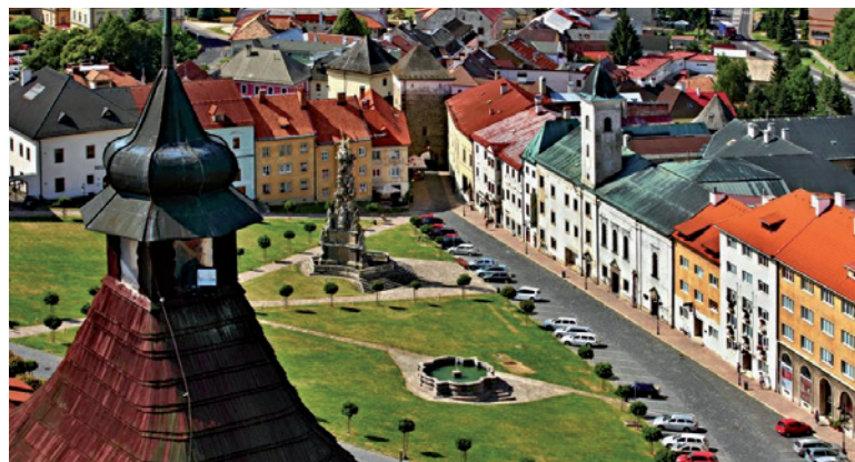
Štefánikovo námestie.

Mestský hrad tvorí súbor stavieb zo 14. - 15. stor., chránený dvojitém opevnením, na ktoré sa pripájajú jedny z najzachovalejších mestských hradieb na Slovensku. Dominantou stavbu hradného areálu je Kostol sv. Kataríny. Ranogotický karnier z 1. pol. 14. stor. mal dve funkcie. Spodná časť objektu slúžila ako kostnica, teda ako priestor na uloženie kostí z okolitých starších hrobov a vrchná ako kaplnka. Pôvodne bola kaplnka zasvätená sv. Michalovi, neskôr sv. Ondrejovi. Steny kaplnky sú zdobené gotickými nástennými maľbami