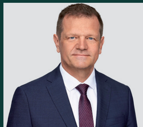
Peter Kmec podpredseda vlády Slovenskej republiky pre Plán obnovy a znalostnú ekonomiku

S podielom 54 % vyplatených zdrojov sme sa tak zaradil na piate miesto v EÚ a na prvé miesto vo V4.“