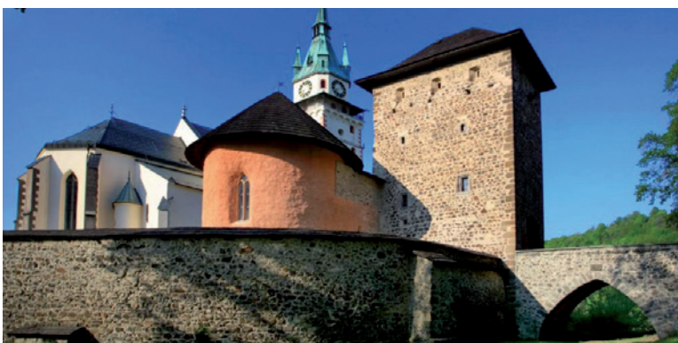
Mestský hrad.

Objekty mincovne v opevnenom meste sú postavené na mieste niekoľkých starších meštianskych domov. Súbor zachovaných výrobných, administratívnych a obytných budov je výsledkom zložitých stavebných premien od 15. stor. podnes. Kremnická mincovňa sa spolu s budín-