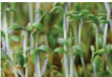
zdroj foto beauty_of_nature pixabay » ren

Použitie - Žeruchou si môžete posypať chlieb s maslom či syrom, alebo varené zemiaky, pridávať ju však môžete aj do nátierok, zeleninových šalátov či do polievok.