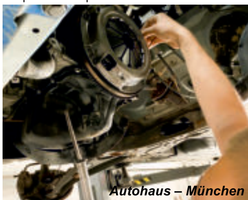
Autohaus – München