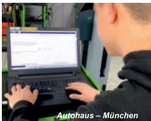
Autohaus – München

Autoopravári na praxi v Autohause v Mníchove