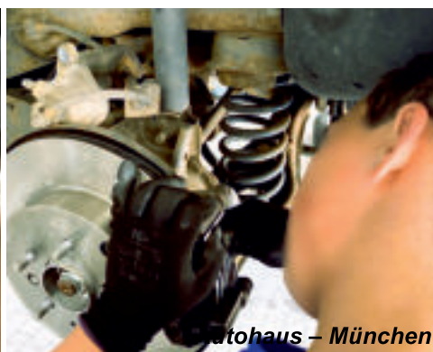
Autohaus – München

➤ Autoopravár(-ka) - mechanik (výučný list)