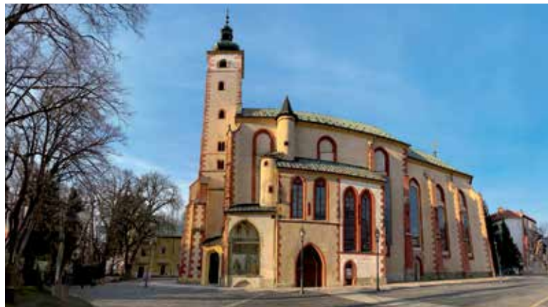
Kostol Nanebovzatia Panny Márie.

najznámejšou dominantou Námestia SNP v Banskej Bystrici. V minulosti mala viaceré názvy: Hodinová – z čias jej výstavby, Vážnicová – lebo stála vedľa budovy mestskej váhy, Zelená – kvôli sfarbeniu jej medenej strechy a od konca 19. storočia Šikmá - vďaka jej vychýleniu. S jej stavbou sa začalo v roku 1552, ale dnešná podoba veže je z čias barokovej prestavby po ničivom požiari v roku 1761. Spolu s obnovou historického námestia v rokoch 1993 – 96 došlo aj k jej komplexnej rekonštrukcii a odvtedy môžu návštevníci vystúpiť po 117 drevených schodoch na ochodzu veže, odkiaľ sa im naskytne nádherný výhľad nielen do hĺbky Námestia SNP, Kapitulskej ulice či na Mestský hrad, ale aj na okolité kopce Veľkej Fatry, Nízkych Tatier, Kremnických a Starohorských vrchov, v ktorých boli ukryté ložiská medi tak významné pri rozvoji mesta.