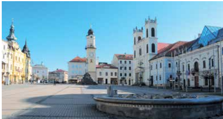
Námestie SNP a Hodinová veža.

najznámejšou dominantou Námestia SNP v Banskej Bystrici. V minulosti mala viaceré názvy: Hodinová – z čias jej výstavby, Vážnicová – lebo stála vedľa budovy mestskej váhy, Zelená – kvôli sfarbeniu jej medenej strechy a od konca 19. storočia Šikmá - vďaka jej vychýleniu. S jej stavbou sa začalo v roku 1552, ale dnešná podoba veže je z čias barokovej prestavby po ničivom požiari v roku 1761. Spolu s obnovou historického námestia v rokoch 1993 – 96 došlo aj k jej komplexnej rekonštrukcii a odvetvy môžu návštevníci vystúpiť po 117 drevených schodoch na ochodzu veže, odkiaľ sa im naskytne nádherný výhľad nielen do hĺbky Námestia SNP, Kapitulskej ulice či na Mestský hrad, ale aj na okolité kopce Veľkej Fatry, Nízkyh Tatier, Kremnických a Starohorských vrchov, v ktorých boli ukryté ložiská medi tak významné pri rozvoji mesta.