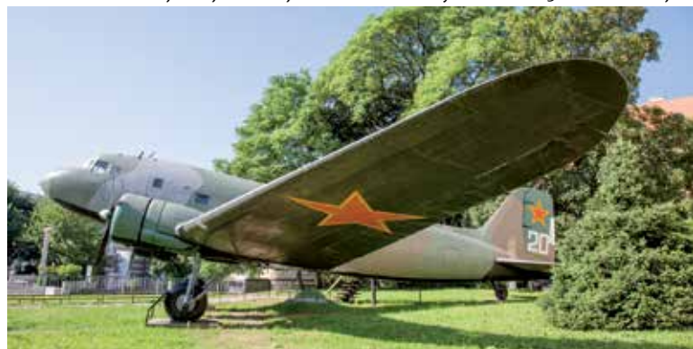
Expozícia v exteriéri – Múzeum SNP.