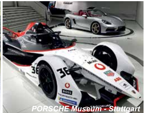
PORSCHE Museum - Stuttgart

➤ Autoopravár(-ka) - mechanik (výučný list)