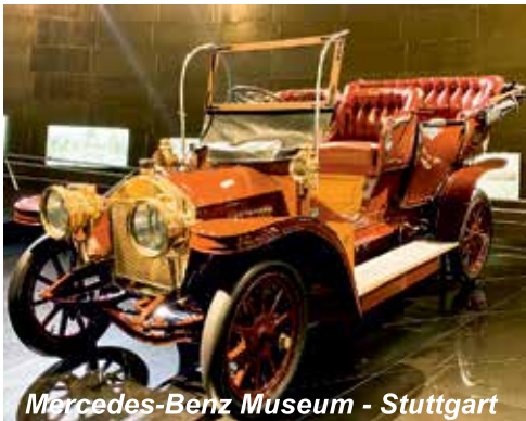
Mercedes-Benz Museum - Stuttgart

Autoopravári na praxi v Autohause v Mníchove - voľno časové aktivity - zážitky