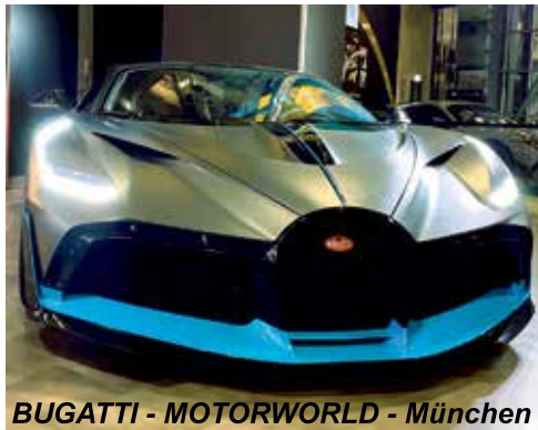
BUGATTI - MOTORWORLD - München