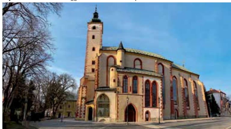
Kostol Nanebovzatia Panny Márie.

diarska spoločnosť. Historické jadro Banskej Bystrice dnes zdobia mnohé stavby z tohto významného obdobia, ktoré dala Bystrici prívlastok „medená“.