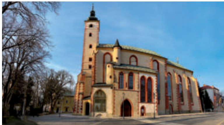
Kostol Nanebovzatia Panny Márie.

najznámejšou dominantou Námestia SNP v Banskej Bystrici. V minulosti mala viaceré názvy: Hodinová – z čias jej výstavby, Vážnicová – lebo stála vedľa budovy mestskej váhy, Zelená – kvôli sfarbeniu jej medenej strechy a od konca 19. storočia Šikmá - vďaka jej vychýleniu. S jej stavbou sa začalo v roku 1552, ale dnešná podoba veže je z čias barokovej prestavby po ničivom požiari v roku 1761. Spolu s obnovou historického námestia v rokoch 1993 – 96 došlo aj k jej komplexnej rekonštrukcii a odvtedy môžu návštevníci vystúpiť po 117 drevených schodoch na ochodzu veže, odkiaľ sa im naskytne nádherný výhľad nielen do hĺbky Námestia SNP, Kapitulskej ulice či na Mestský hrad, ale aj na okolité kopce Veľkej Fatry, Nízkych Tatier, Kremnických a Starohorských vrchov, v ktorých boli ukryté ložiská medi tak významné pri rozvoji mesta.