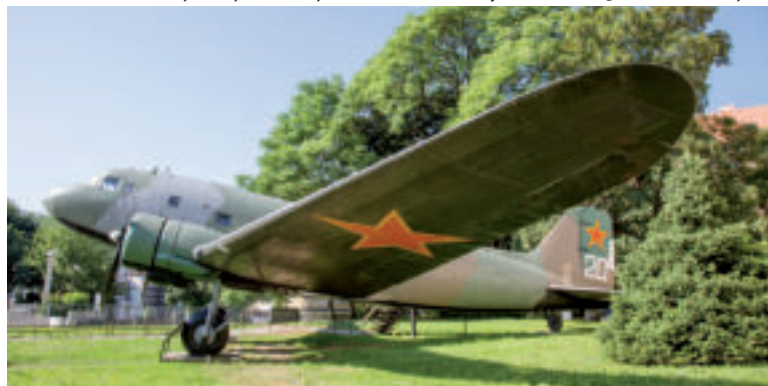
Expozícia v exteriéri – Múzeum SNP.

Do areálu Mestského hradu sa pôvodne vstupovalo cez Petermannovu vežu – donjon, opevnenú obytnú vežu, v ktorej bola vstupná brána s padacím mostom. Po veľkom požiari v roku 1500, kedy bol značne zničený aj hrad, pristavali k veži Barbakán – predsunutý opevnený vstup. Dokončený bol v roku 1512 a stal sa najdô-