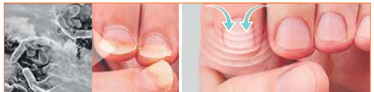
PRED: Zažltnutá nechtová platnička postihnutá plesňovou infekciou.

MycoSupport je prelomová antimykotická kúra vyvinutá švédskymi vedcami z Inštitútu dermatológie v Štokholme, ktorá spôsobila revolúciu v súčasnom prístupe k boju proti tejto chorobe. Nielenže okamžite odstraňuje príznaky, ale predovšetkým natrvalo odstraňuje skutočnú príčinu infekcie bez ohľadu na jej typ. Jediné zmes špeciálne extrahovaných fytoaktívnych zložiek preniká do najhlbších tkanív a priamo napáda bunky húb a dermatofytov nahromadené pod nechtami, nemilosrdne ich ničí a prináša okamžitú úľavu. 100% prírodné rastlinné fytoextrakty majú silné fungicídne, baktericídne, protizápalové a antiseptické vlastnosti, vďaka čomu účinne odstraňujú svrbenie, pálenie, bolesť a začervenanie a redukujú superinfekcie a zápaly.