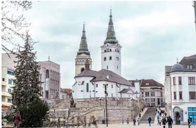
Katedrála na námestí Andreja Hlinku.

Žilina je významnou dopravnou križovatkou, v ktorej sa stretávajú trasy medzinárodného významu spájajúce Slovensko s Českom a Poľskom. V meste sa stretávajú aj hlavné slovenské železničné trate, ktoré sú súčasťou postupne modernizovaného Paneurópskeho dopravného koridoru.