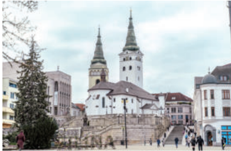
Katedrála na námestí Andreja Hlinku.

Žilina je významnou dopravnou križovatkou, v ktorej sa stretávajú trasy medzinárodného významu spájajúce Slovensko s Českom a Poľskom. V meste sa stretávajú aj hlavné slovenské železničné trate, ktoré sú súčasťou postupne modernizovaného Paneurópskeho dopravného koridoru.