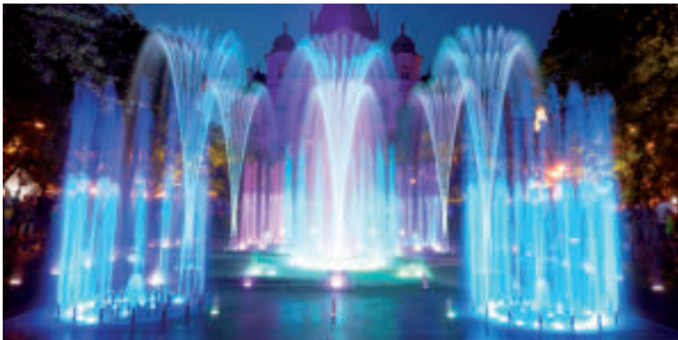
Spievajúca fontána so zvonkohrou.