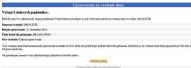
Ukážka podvodného mailu.

verejnosť o týchto podvodných praktikách najmä preto, aby občania zbytočne neprichádzali o svoje peniaze. Finančná správa takýmto spôsobom s daňovými subjektmi nekomunikuje. Preto odporúčame na takéto emaily nereagovať, neklikáť na priložené linky a prípadne sa obrátiť na políciu,“ radí inštitúcia a upozorňuje, že email nie je jediný komunikačný kanál takýchto podvodníkov. Často zasielajú aj podvodné SMS s rôznym textovým znením. „Finančná správa upozorňuje ľudí, aby boli obozretní a neverili týmto podvodným správam. V prípade potreby môžu kontaktovať naše call centrum na čísle 048/4317 222.