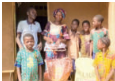
» acn zdroj foto ACN