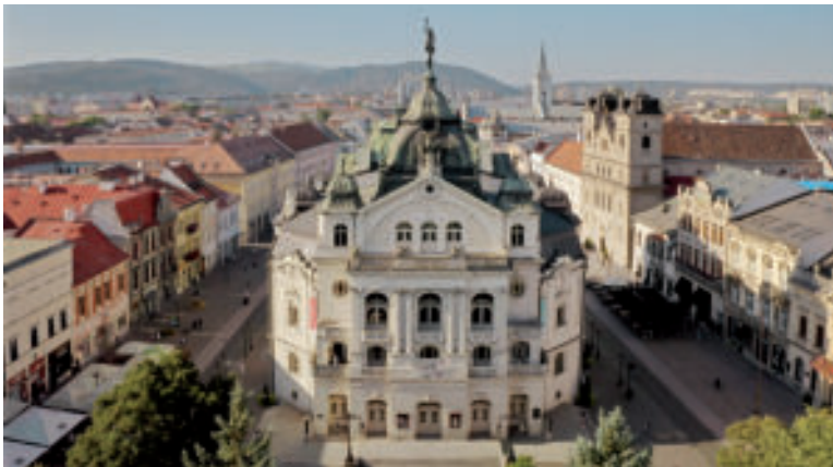
Národné divadlo Košice.