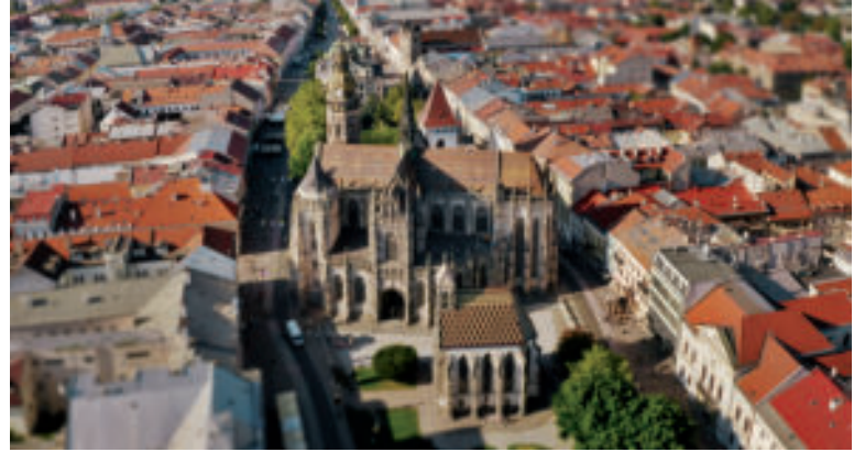
Dóm sv. Alžbety.