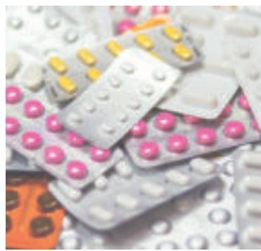
» ren zdroj foto Pexels pixabay

„Užívaním falšovaných liekov môže dôjsť k predávkovaniu alebo zhoršeniu zdravotného stavu,“ uzatvára ŠÚKL.