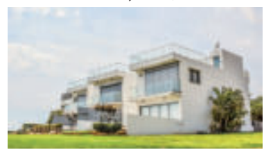
» ren zdroj foto dimitrisvetsikas1969 pixabay

nadobudnutia právoplatnosti rozhodnutia,“ popisuje FS, podľa ktorej k daňovému priznaniu nie je potrebné dokladať dokumenty ako list vlastníctva a podobne. Tie by si úrady mali overiť sami v katastrálnych evidenciách. „V súvislosti s problémami, ktoré aktuálne eviduje kataster, môžu mať niektorí daňovníci problém zistiť, či ich vlastníctvo bolo alebo nebolo zapísané do katastra nehnuteľností v minulom roku, a teda či im vznikla povinnosť podať daňové priznanie k dani z nehnuteľností,“ uvádza Finančná správa a v týchto prípadoch dáva do pozornosti ustanovenie daňového poriadku, ktoré hovorí, že správca dane zo závažných dôvodov odpustí zmeškanie lehoty, ak o to daňový subjekt požiada najneskôr do 30 dní odo dňa, keď odpadli dôvody zmeškania, a ak v tej istej lehote urobí zmeškaný úkon. „Z toho vyplýva, že v tomto prípade, môže správca dane odpustiť zmeškanie lehoty na žiadosť daňového subjektu, v dôsledku čoho nebude daňovému subjektu uložená pokuta za správny delikt nepodania daňového priznania v zákonom stanovenej lehote,“ uzatvára FS.