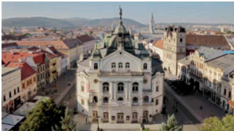
Národné divadlo Košice.

Ak vás potulky Košicami už trochu unavia, príjemné posedenie a oddych si môžete užiť poniže Národného divadla Košice, kde sa nachádza mimoriadne obľúbená Spievajúca fontána s parkom pre oddych. Fontána počas letných dní reaguje nielen na vlastnú hudbu, no každú hodinu sa rozozvučí do rytmu neďalekej