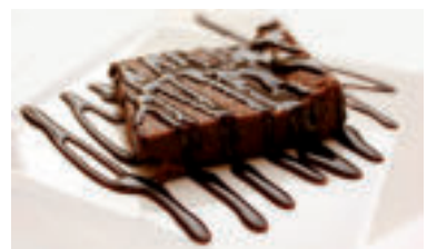
Ilustračné foto. zdroj fotokreativekama pixabay

Na ozdobenie: posekané orechy alebo mandle či pistácie, sušené jahody alebo maliny, kokosové lupienky a podobne