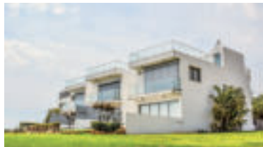
» ren zdroj foto dimitrisvetsikas1969 pixabay

nadobudnutia právoplatnosti rozhodnutia,“ popisuje FS, podľa ktorej k daňovému priznaniu nie je potrebné dokladať dokumenty ako list vlastníctva a podobne. Tie by si úrady mali overiť sami v katastri nehnuteľností. „V súvislosti s problémami, ktoré aktuálne eviduje kataster, môžu mať niektorí daňovníci problém zistiť, či ich vlastníctvo bolo alebo nebolo zapísané do katastra nehnuteľností v minulom roku, a teda či im vznikla povinnosť podať daňové priznanie k dani z nehnuteľnosti,“ uvádza Finančná správa a v týchto prípadoch dáva do pozornosti ustanovenie daňového poriadku, ktoré hovorí, že správca dane zo závažných dôvodov odpustí zmeškanie lehoty, ak o to daňový subjekt požiada najneskôr do 30 dní odo dňa, keď odpadli dôvody zmeškania, a ak v tej istej lehote urobí zmeškaný úkon. „Z toho vyplýva, že v tomto prípade, môže správca dane odpustiť zmeškanie lehoty na žiadosť daňového subjektu, v dôsledku čoho nebude daňovému subjektu uložená pokuta za správny delikt nepodania daňového priznania v zákonom stanovenej lehote,“ uzatvára FS.