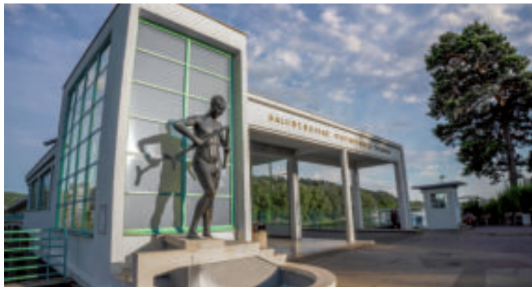
Barlolámač a Kolonádový most.

Ak sa v Piešťanoch plánujete zdržať dlhšie, nevynechajte ani návštevu Balneologického múzea Imricha Wintera.