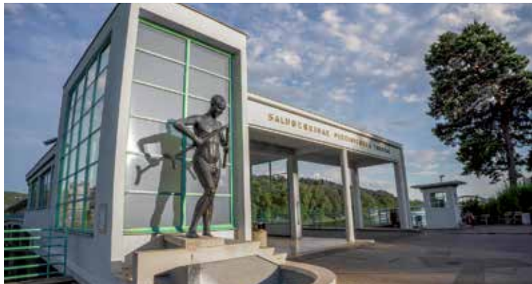
Barlolámač a Kolonádový most.

Nájdete tu archeológiu regiónu Piešťan, nálezy z bohatých kniežacích hrobov z Krakovian-Stráží, národopis regiónu s ľudovým domom s pôvodným zariadením a zbierkami keramiky, ľudových plastík, krojov, obrazov, expozíciu približujúcu dejiny Piešťan a dejiny Piešťanských kúpeľov. Časť expozície je venovaná najvýznamnejším minerálnym vodám Slovenska a samostatná časť expozície je venovaná významnej osobnosti slovenských i európskych dejín – gen. M. R. Štefánikovi. Pri príležitosti stého výročia narodenia slovenského básnika Ivana Krasku Balneologické múzeum slávnostne otvorilo v priestoroch jeho piešťanského bytu expozíciu Pamätná izba Ivana Krasku.