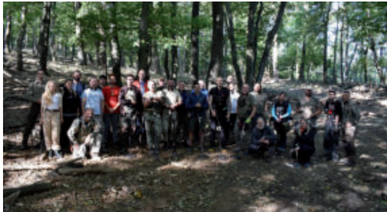
Prieskumný tím – archeológovia z Pamiatkového úradu SR a Krajského pamiatkového úradu Nitra a dobrovoľníci z Občianskeho združenia Hradiská a Archeo Moravia z.s. Foto: P. Kmeťová, 2024

Iný, predsunutý kamenný val, chránil hradisko zo severozápadnej strany. „O vnútornej štruktúre hradiska sa donedávna veľa nevedelo. Až vizualizácia dát získaných leteckým laserovým skenovaním, ktoré realizoval T. Lieskovský pre Pamiatkový úrad SR odhalila, že časť areálu bola upravená do systému umelých terás. Na základe poznatkov z iných výskumov vieme, že na terasách veľmi pravdepodobne stáli stavby ako domy, dielne a podobne. Viditeľné sú aj pozostatky starých ciest, z ktorých jedna prepájala vstupné brány na opačných stranách opevneného areálu. Ďalšie poznatky priniesol geofyzikálny prieskum severnej časti areálu hradiska v roku 2021. Vďaka tejto metóde sa podarilo zistiť existenciu početných archeologických objektov pod zemou, ale aj ďalšie informácie k opevneniu,“ približujú odborníci. Doklady o intenzívnom osídlení