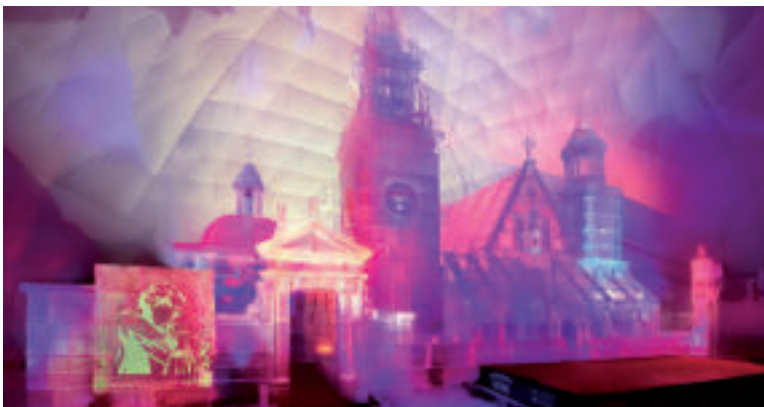
Tatranský ľadový dóm.