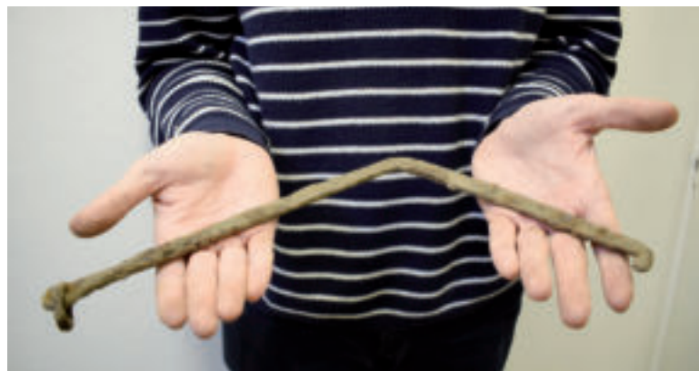
Veľký železný kľúč z doby laténskej - keltské osídlenie. Tento kľúč nemal pasovať do zámku, ale používal sa do systému na spôsob haspry dverí/vrát.

Rozsiahly priestor o rozlohe 15,6 hektárov je chránený masívnym valom vybudovaným z lomového kameňa, ktorý má z vonkajšej strany zachovanú výšku 4 až 7 m a šírku 20 až 26 m. Na severozápadnej strane je spevnený ďalšou líniou valu.