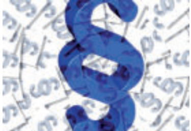
» ren zdroj foto geralt pixabay

digitálnych dokladov v mobilných zariadeniach a ich overovanie kontrolnými orgánmi. Na vytvorenie digitálneho dokladu sa použije aplikácia Doklady v mobile v správe Ministerstva vnútra SR, ktorá zabezpečí okrem iného i jeho potrebnú verifikáciu. Do budúcnosti sa pripravuje aj scenár, kedy k verifikácii dokladu bude môcť dôjsť aj v prípade nedostupnosti či nemožnosti použiť internetové pripojenie - offline scenár,“ priblížil rezort vnútra a dodal, že zavádzanie elektronických preukazov je úzko prepojené s európskou legislatívou a cieľmi EÚ v oblasti digitálnej identity. Európsku peňaženku digitálnej identity zavádza do slovenskej právnej úpravy novela zákona o dôveryhodných službách, ktorú takisto schválila Národná rada SR. Novelu pripravil Národný bezpečnostný úrad v spolupráci s Ministerstvom vnútra SR.