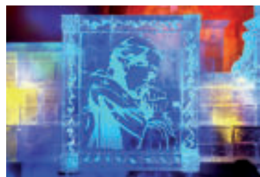
Tatranský ľadový dóm.

Svätý otec navštívil Vysoké Tatry na slovenskej strane v roku 1995. Počas svojej návštevy oddychoval v altánku pri Sliezskom dome, preletel sa vrtuľníkom ponad Tatry a osobne posvätil drevený kríž ako aj symboly horských záchranárov – lano a čakán. Osobnosť pápeža Jána Pavla II. bude v Tatranskom ľadovom dome pripomínať nielen jeho portrét vytesaný v ľade, ale aj stavby, ktoré v jeho živote zohrali mimoriadnu úlohu. Wawelská katedrála, v ktorej bol v roku 1958 vysvätený za biskupa a Kostol sv. Vojtecha, v ktorom sa dlhé roky