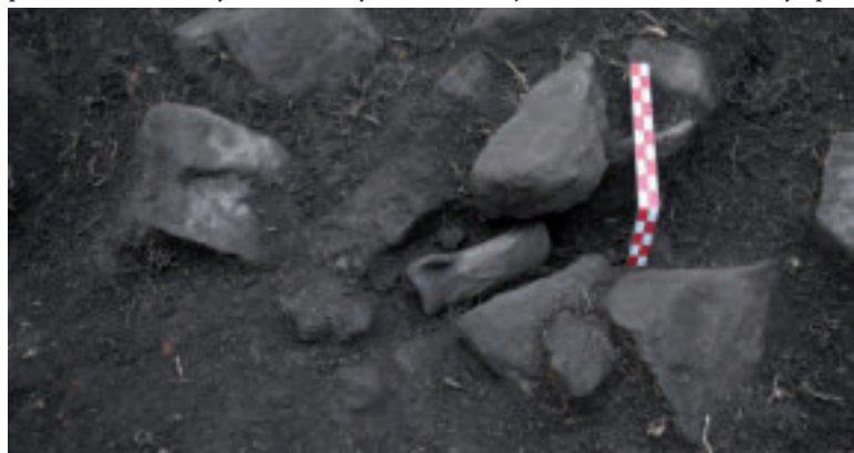
Sekerka z doby bronzovej - typ s tulajkou a uškom. in situ

čiach, keď bolo hradisko neosídlené, sa naň ľudia vrátili. „Išlo o keltské obyvateľstvo, ktoré na tomto mieste našlo útočisko v storočiach pred prelomom letopočtov. Staré opevnenie muselo byť stále mohutné a vzbudzovať pocit väčšieho bezpečia. O prítomnosti Keltov svedčia nálezy drobných spôn či masívny železný kľúč. Nasledovalo opäť niekoľko storočí bez ľudí, až do turbulentného záveru doby rímskej a obdobia sťahovania národov - 4. – 5. storočie, keď v ňom hľadalo ochranu germánske obyvateľstvo. Na hradisku sa po nich zachovali bronzové a železné spony, najmä vo fragmentoch, a zlomky malých kruhových zrkadielok. Či sa obyvateľstvu podarilo prežiť v bezpečí, nevieme. Je však veľmi pravdepodobné, že po ich odchode už hradisko nebolo nikdy dlhšie osídlené. Isté využitie našlo aj v období stredoveku. Hroty šípov