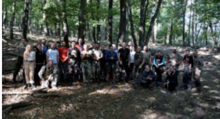
Prieskumný tím – archeológovia z Pamiatkového úradu SR a Krajského pamiatkového úradu Nitra a dobrovoľníci z Občianskeho združenia Hradiská a Archeo Moravia z.s.

Iný, predsunutý kamenný val, chránil hradisko zo severozápadnej strany. „O vnútornej štruktúre hradiska sa donedávna veľa nevedelo. Až vizualizácia dát získaných leteckým laserovým skenovaním, ktoré realizoval T. Lieskovský pre Pamiatkový úrad SR odhalila, že časť areálu bola upravená do systému umelých terás. Na základe poznatkov z iných výskumov vieme, že na terasách veľmi pravdepodobne stáli stavby ako domy, dielne a podobne. Viditeľné sú aj pozostatky starých ciest, z ktorých jedna prepájala vstupné brány na opačných stranách opevneného areálu. Ďalšie poznatky priniesol geofyzikálny prieskum severnej časti areálu hradiska v roku 2021. Vďaka tejto metóde sa podarilo zistiť existenciu početných archeologických objektov pod zemou, ale aj ďalšie informácie k opevneniu,“ približujú odborníci. Doklady o intenzívnom osídlení