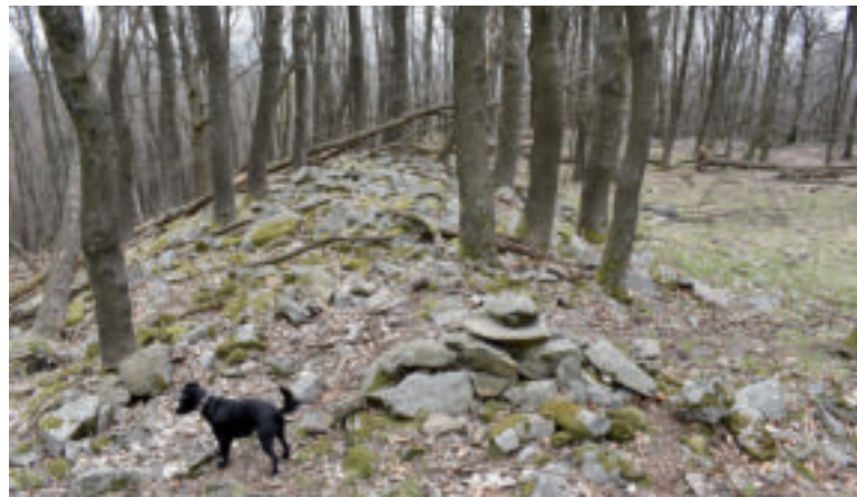
Hradisko na vrchole Veľkého Tribeča je opevnené masívnym valom z lomového kameňa. Jeho zachovaná výška z vnútornej strany je pomerne nízka (max. cca 1 m), ale z vonkajšej strany dosahuje 4 – 7 m.