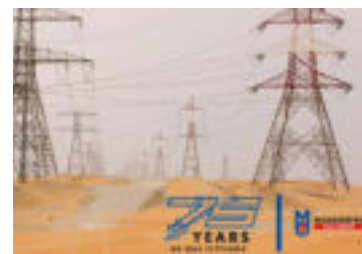
Spoločnosť MOSDORFER vyrába tlmieče prvky už 75 rokov.