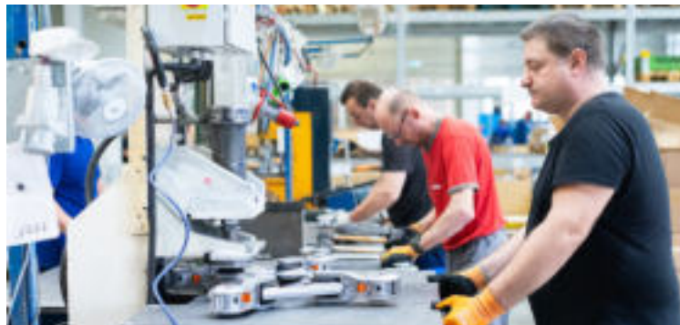
Posledný krok, spájanie garnitúry s rámom.

tion. „Je to veľmi pevný odliatok z hliníka a výborne odoláva korózii. Na vedení vysokého napätia vydrží desiatky rokov.“ ML Produktion svoje výrobky dis-