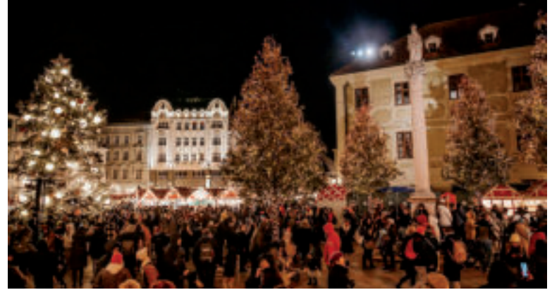
Vianočné trhy v Bratislave.

Najkrajšie sviatky v roku sa nezadržateľne blížia a aj do mesta pod Urpínom prinesú nezameniteľnú vianočnú náladu. Vianočný stromček, tisíce svetielok vianočnej výzdoby, ekologické vianočné trhy plné chuti a vóni, zvyky a tradície s bohatým kultúrnym programom. To všetko sa v srdci Banskej Bys-