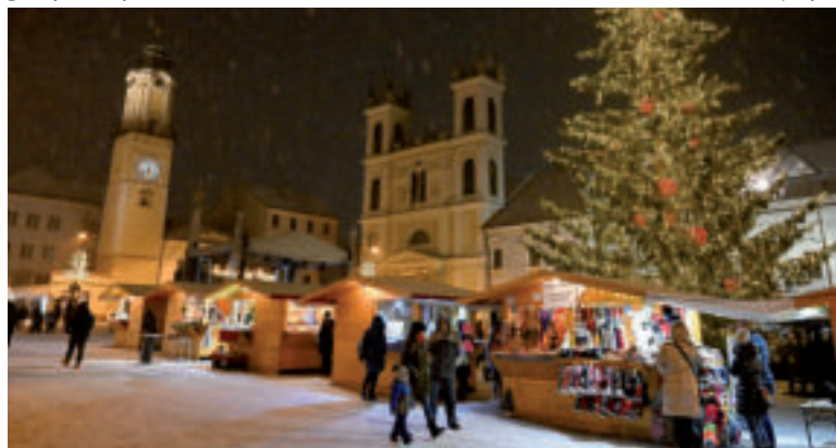
Vianočné trhy v Banskej Bystrici.

Najkrajšie sviatky v roku sa nezadržateľne blížia a aj do mesta pod Urpínom prinesú nezameniteľnú vianočnú náladu. Vianočný stromček, tisíce svetielok vianočnej výzdoby, ekologické vianočné trhy plné chuti a vône, zvyky a tradície s bohatým kultúrnym programom. To všetko sa v srdci Banskej Bys-