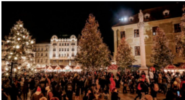
Vianočné trhy v Bratislave.