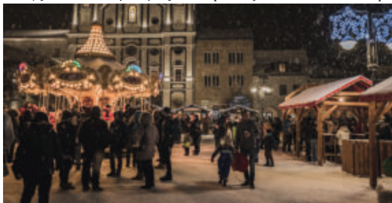
Vianočné trhy v Žiline.

Vianočné trhy v tomto roku štartujú v piatok 29. novembra koncertmi a po-