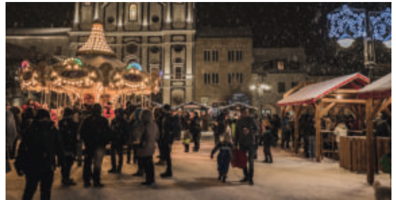
Vianočné trhy v Žiline.

Vianočné trhy v tomto roku štartujú v piatok 29. novembra koncertmi a po-