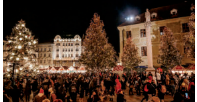
Vianočné trhy v Bratislave.

Najkrajšie sviatky v roku sa nezadržateľne blížia a aj do mesta pod Urpínom prinesú nezameniteľnú vianočnú náladu. Vianočný stromček, tisíce svetielok vianočnej výzdoby, ekologické vianočné trhy plné chuti a voní, zvyky a tradície s bohatým kultúrnym programom. To všetko sa v srdci Banskej Bys-