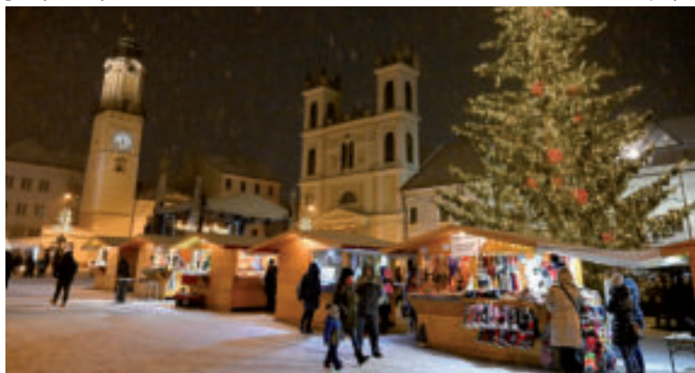
Vianočné trhy v Banskej Bystrici.

Stánky na Hlavnom vianočnom trhu sa otvoria už 21. novembra a vianočná atmosféra zostane po prvýkrát v hlavnom meste až do sviatku Troch kráľov. Trh bude zatvorený iba tri dni počas vianočných sviatkov. Na Hlavnom a Primaciálnom námestí vyrastie 75 stánkov, gastro a nápoje ponúkne 37 predajcov a predajkyň. Vianočné trhy skrásli majestátna, 12 m vysoká jedľa biela. Ozdobia ju svetelné reťaze a približne 313 gúľ, čip skrásli vianočná hviezda. Silne zastúpený bude aj kultúrny program. Na Františkánskom námestí zaznejú každý piatok a v sobotu spevácke zbory a folklórne súbory. Nedele budú venované vianočným koncertom. Na dôležité dni adventu spátými s typickými zvykmi a obradmi, ako sviatkov