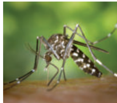
Ilustračné foto. mozgových blán.

Usutu vírus - infekcia je vo väčšine prípadov asymptomatická alebo spojená s miernymi symptómami, napríklad horúčkou. U pacientov s oslabeným imunitným systémom a starších pacientov sa môže zriedka objaviť zápal mozgu alebo zápal