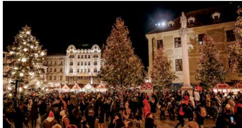
Vianočné trhy v Bratislave.

Novinkou týchto Bratislavských Vianoc je hra Škriatkov kúzlo. Keďže čaro