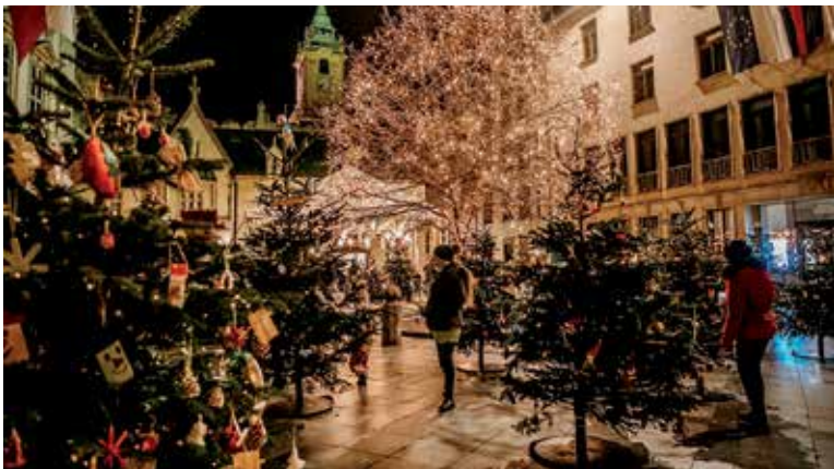
Vianočné trhy v Bratislave.

Informácie poskytl Mesto Banská Bystrica