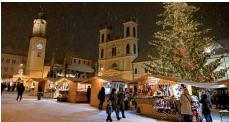
Vianočné trhy v Banskej Bystrici.