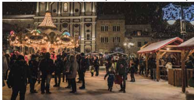
Vianočné trhy v Žiline.

Najkrajšie sviatky v roku sa nezadržateľne blížia a aj do mesta pod Urpínom prinesú nezameniteľnú vianočnú náladu. Vianočný stromček, tisíce svetielok vianočnej výzdoby, ekologické vianočné trhy plné chuti a vône, zvyky a tradície s bohatým kultúrnym programom. To všetko sa v srdci Banskej Bys-