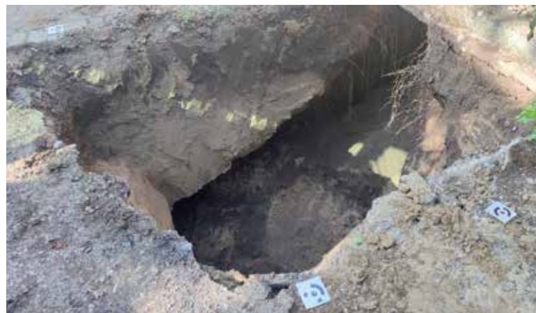
Loch s prepadnutým stropom.