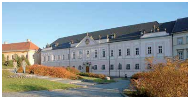
Horné mesto – Veľký seminár.

Najdominantnejšou pamiatkou mesta je Nitriansky hrad. Ide o národnú