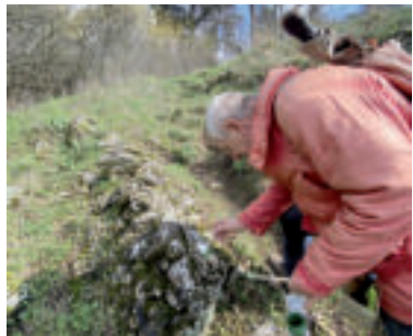
Náučný chodník Smolenický kras.

V severnom svahu doliny Hlboča v Smolenickom krase je viacero jaskýň. Tie sú ponorní niekdajšieho povrchového toku, ktorý tiekol týmto údolím. Dostali názov Mníchove diery a za verejnosti voľne prístupnú bola vyhlásená najznámejšia a najdostupnejšia z nich. „Okresný úrad Trnava vyhlásil Mníchovu dieru 1 za verejnosti voľne prístupnú jaskyňu s účinnosťou od 1. novembra 2024 za účelom poznávania jej prírodných a historických hodnôt. Turisti sa