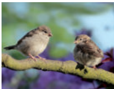
» ren zdroj foto Oldiefan pixabay

Informácie poskytla Slovenská ornitologická spoločnosť / BirdLife Slovensko