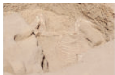
Kostra osla.

Pri pokračovaní prác, ktoré započali egyptológovia počas uplynulých sezón, dokopali hrobovú jamu veľkého hyksóskeho hrobu, objaveného už v roku 2012. Nebožtík, ktorý mal v dobe svojej smrti viac ako 50 rokov, mal východne od svojej tehlovej hrobky pochovaného osla. „Somáre boli pochovávané v Egypte už pred viac než päťtisíc rokmi a našli sa aj pri hrobch najstarších egyptských faraónov v Abyde. V našom prípade však bol somár o viac ako tisíc rokov mladší než jeho abydoskí predchodcovia.