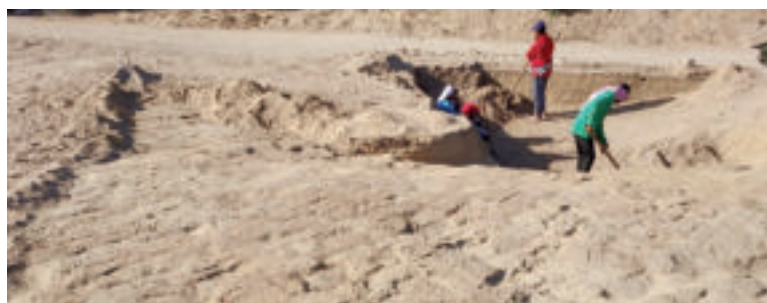
Zvyšky hradby Ramesseho III.

„Skúmali sme aj obranné konštrukcie zo záveru Novej ríše, z 12. storočia pred Kristom. Okrem ich lepšieho poznania sme získali aj poznatky o zániku pevnosti faraóna Ramesseho III. Na povrchu rozpadnutého zvyšku hradby faraónovej pevnosti bol objavený amulet hadieho božstva menom Nehebkau, z Neskorej doby, čiže 664 až 332 pred Kristom. Nález amuletu na hradbe by mohol naznačovať, že musela byť už