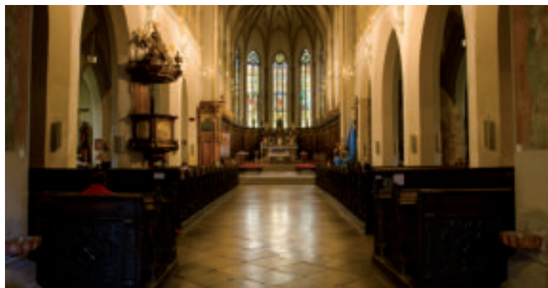
Bazilika sv. Mikuláša.