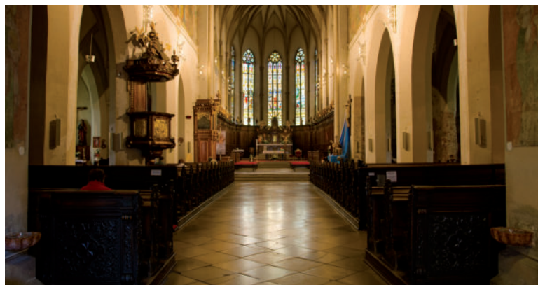
Bazilika sv. Mikuláša.