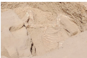
Kostra osla.

Pri pokračovaní prác, ktoré započali egyptológovia počas uplynulých sezón, dokopali hrobovú jamu veľkého hyksóského hrobu, objaveného už v roku 2012. Nebožtík, ktorý mal v dobe svojej smrti viac ako 50 rokov, mal východne od svojej tehlovej hrobky pochovaného osla. „Somáre boli pochovávané v Egypte už pred viac než päťtisíc rokmi a našli sa aj pri hrobch najstarších egyptských faraónov v Abyde. V našom prípade však bol somár o viac ako tisíc rokov mladší než jeho abydoskí predchodcovia.