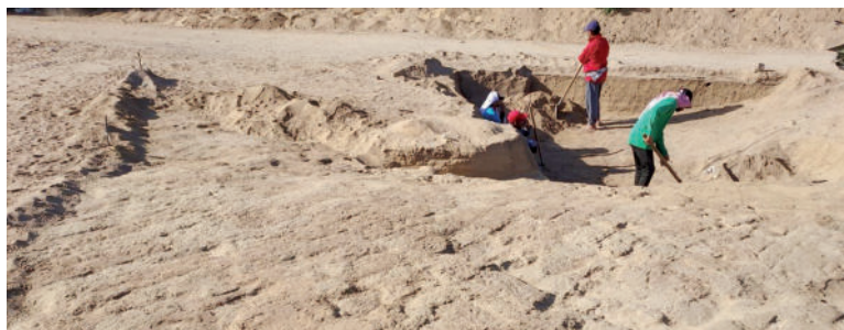
Zvyšky hradby Ramesseho III.

„Skúmali sme aj obranné konštrukcie zo záveru Novej ríše, z 12. storočia pred Kristom. Okrem ich lepšieho poznania sme získali aj poznatky o zániku pevnosti faraóna Ramesseho III. Na povrchu rozpadnutého zvyšku hradby faraónovej pevnosti bol objavený amulet hadieho božstva menom Nehebkau, z Neskorej doby, čiže 664 až 332 pred Kristom. Nález amuletu na hradbe by mohol naznačovať, že musela byť už