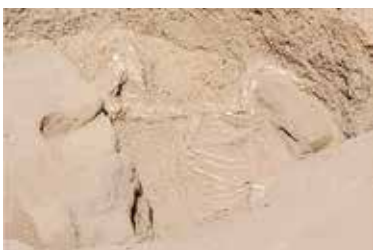
Kostra osla.

Pri pokračovaní prác, ktoré započali egyptológovia počas uplynulých sezón, dokopali hrobovú jamu veľkého hyksóskeho hrobu, objaveného už v roku 2012. Nebožtík, ktorý mal v dobe svojej smrti viac ako 50 rokov, mal východne od svojej tehlovej hrobky pochovaného osla. „Somáre boli pochovávané v Egypte už pred viac než päť tisíc rokmi a našli sa aj pri hrobch najstarších egyptských faraónov v Abyde. V našom prípade však bol somár o viac ako tisíc rokov mladší než jeho abydoski predchodcovia.