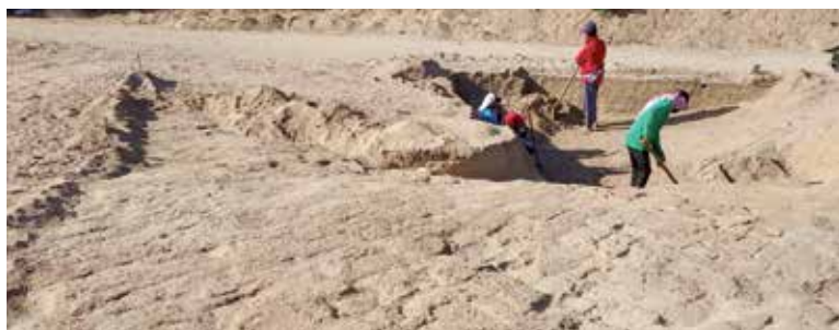
Zvyšky hradby Ramesseho III.

„Skúmali sme aj obranné konštrukcie zo záveru Novej ríše, z 12. storočia pred Kristom. Okrem ich lepšieho poznania sme získali aj poznatky o zániku pevnosti faraóna Ramesseho III. Na povrchu rozpadnutého zvyšku hradby faraónovej pevnosti bol objavený amulet hadieho božstva menom Nehebkau, z Neskorej doby, čiže 664 až 332 pred Kristom. Nález amuletu na hradbe by mohol naznačovať, že musela byť už