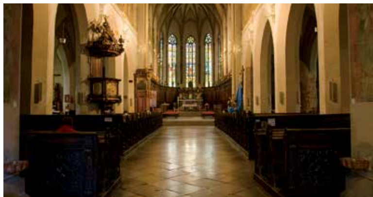
Bazilika sv. Mikuláša.