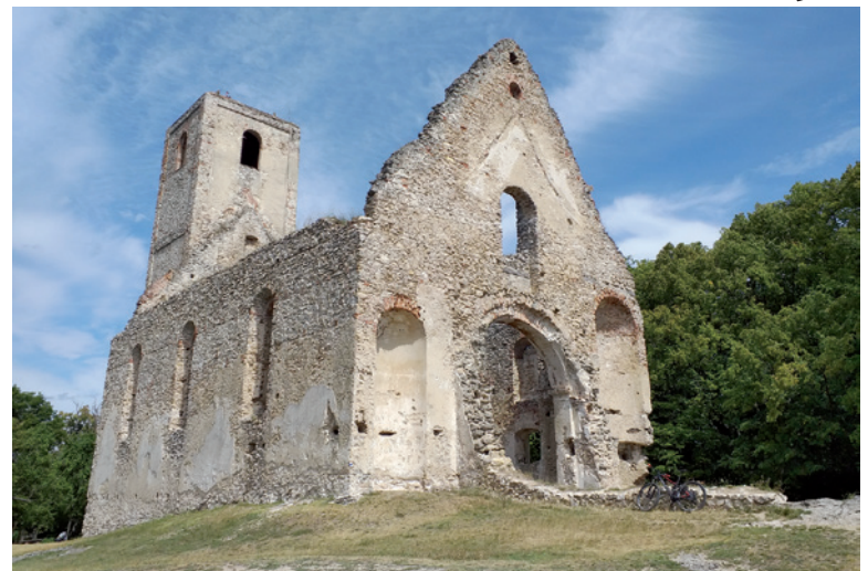
Zažite magickú atmosféru Katarínky.