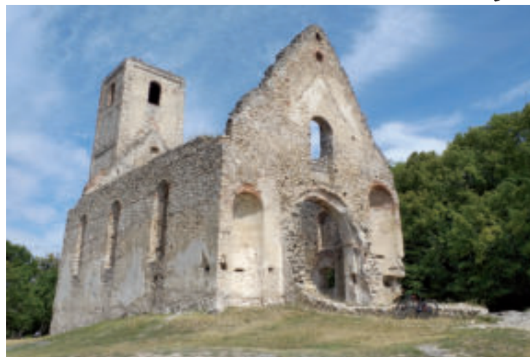
Zažite magickú atmosféru Katarínky.