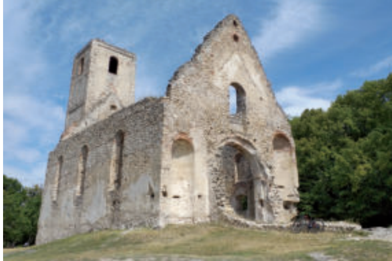
Zažite magickú atmosféru Katarínky.