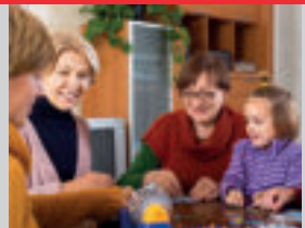
S RODINOU A PRIATEĽMI

Začnete znova počuť, čo vám blízki ľudia hovoria a o čom hovoria.