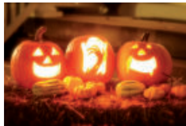
» ren K jeseni patria vyrezávané tekvice.

• Ak na tekvici ešte po vyrezaní zostali čiary od fixky, zmyte ich navlhčeným obrúskom. Do tekvice na záver umiestnite svetlo. Použití sa dá klasická alebo čajová sviečka, prípadne menšia baterka.