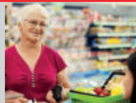
V PREDAJNI, NA POŠTE

Budete počuť každé slovo kňaza, takže sa zúčastníte na omši ako doteraz.