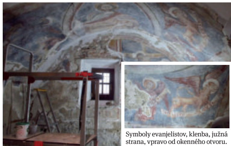
Celkový pohľad na nález v sakristii.