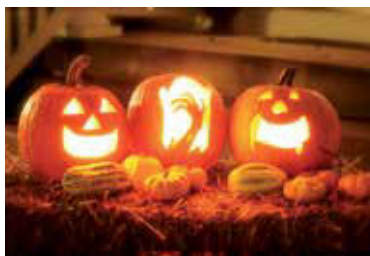
» ren K jeseni patria vyrezávané tekvice.

• Ak na tekvici ešte po vyrezaní zostali čiary od fixky, zmyte ich navlhčeným obrúskom. Do tekvice na záver umiestnite svetlo. Použiť sa dá klasická alebo čajová sviečka, prípadne menšia baterka.