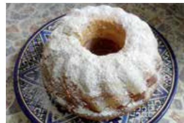
» ren Ilustračná foto. autor Bernadette pixabay

Dve tretiny cesta vlejte do vymastenej a múkou vysypanej formy. Do zvyšného cesta vmiešajte kakao a následne zmes vylejte do formy. Bábovku pečte v rúre vyhriatej na 175 stupňov Celzia 40 až 45 minút.