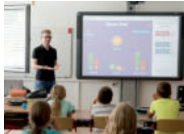
Ilustračné foto. zdroj foto steveriot1 pixabay

Predpokladaná nákladovosť pilotného projektu sa pohybuje na úrovni 137 700 eur. Ministerstvo vnútra v pokračovaní projektu ráta s celkovými nákladmi 62 706 153 eur na celkový počet 2 967 základných a stredných škôl. Inštalácia kamerových systémov by bola v pokračovaní projektu postupne realizovaná v najbližších dvoch rokoch. Projekt bude financovaný zo zdrojov Európskej únie.