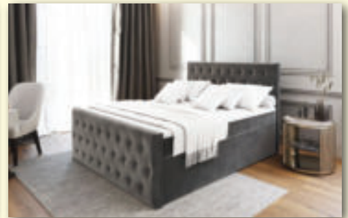
Vysoké posteľ od 140 cm do 200 cm CENA od 610 €