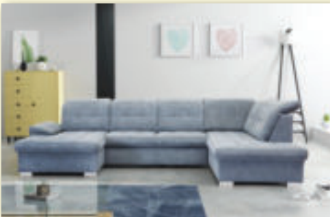
Rozkladacia sedacia súprava NICOL šírka 330 cm s nastaviteľnými opierkami hlavy pôvodná cena 1 355 € / AKCIA 1 190 €