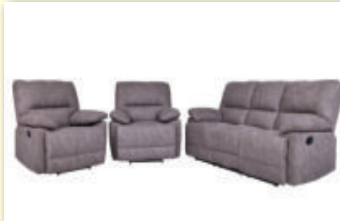
Sedacia súprava RELAX 3+1+1 s funkciou relaxu pôvodná cena 2 475 € / AKCIA 1 590 €