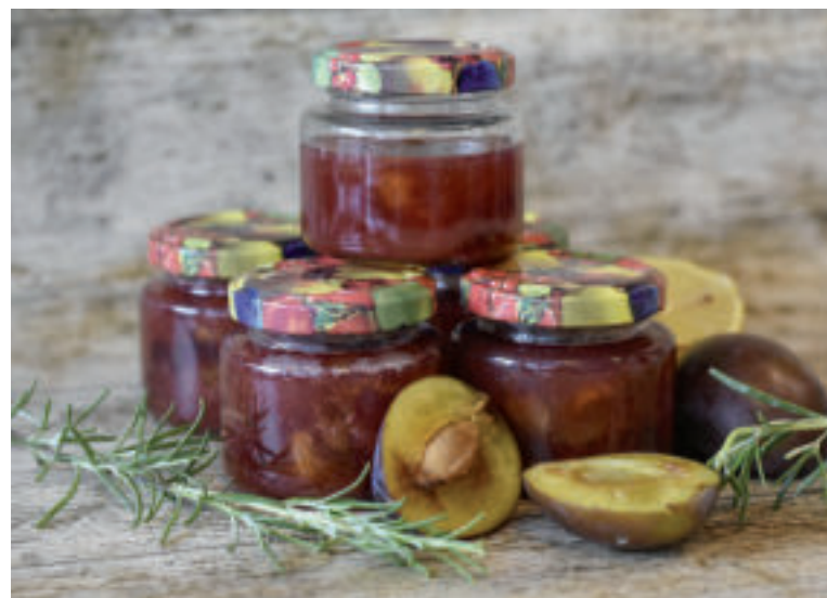
Slivky sú vhodné na výrobu domácich džemov a lekvárov.

šime na 60 °C. Treba myslieť na to, že slivky budú počas sušenia púšťať šťavu, ktorá sa bude odparovať. Dvierka na rúre by preto mali byť pootvorené.