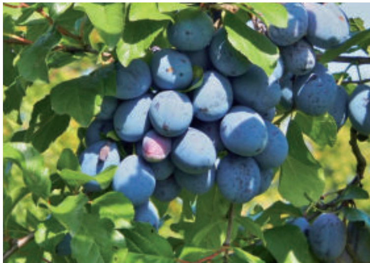
Slivky sú chutné a plné vitamínov.

Slivky pred sušením umyjeme pod tečúcou vodou, následne ich narežeme nožom a vyberieme z nich kôstky. Sušiť ich môžeme v elektrickej rúre tak, že plech vystelieme papierom na pečenie a rovnomerne naň poukladáme pripravené slivky. Jednotlivé kusy by sa