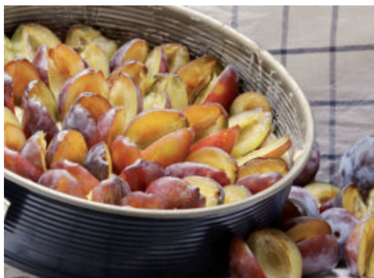
Slivkové koláče sú veľmi obľúbené.

Postup: Sušené slivky zalejeme horúcou vodou a necháme v nej namočené približne 15 minút. Zatiaľ si sušenú šunku rozkrojíme pozdĺžne, každý plátek na dva pásiky. Každú slivku omotáme jedným pásikom sušenej šunky a prepichnete špáradlom. Slivkové závitky pokladíme na plech vystlaný papierom na pečenie a pečieme v rúre vyhriatej na 180 stupňov približne 15 minút.