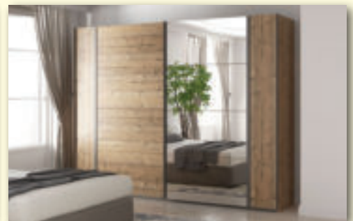
Šatníková skriňa MURAI šírka 220 cm, 270 cm CENA od 404 €

ZÁCLONY - 50% až 70 % | KOBERCE - 30% až 50 % | LUSTRE - 50%