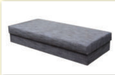
Válánda s úložným priestorom ERIK šírka od 90 cm do 120 cm výškou spania 43 cm CENA od 180 €