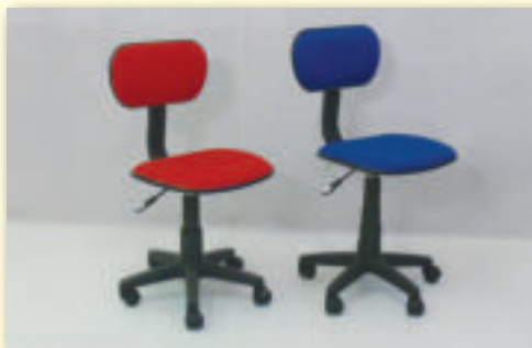
Detská otočná stolička BAMBO pôvodná cena 25 € / AKCIA 16 €