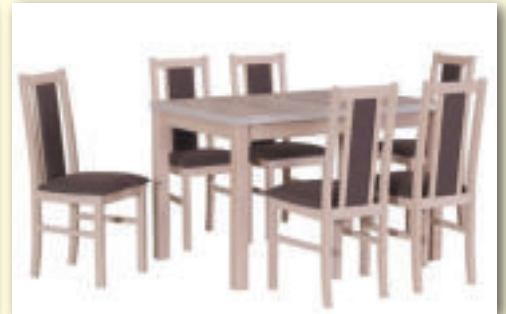
Rozkladací jedálský stôl MAX V so stoličkami BOSS XIV rozmer stola 120/150 cm x 80 cm Stôl cena 167 €, Stolička 47€