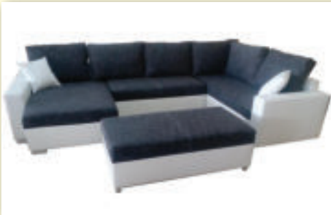
Sedacia súprava MULTI s taburetkaou šírka: 330 cm CENA 820 €

Tovar máme skladoom. Akcia trvá do vypredania zásob.