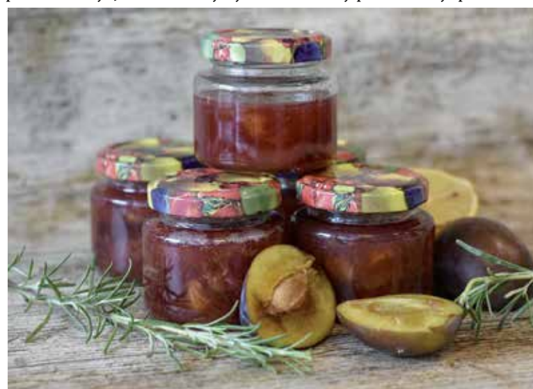
Slivky sú vhodné na výrobu domácich džemov a lekvárov.

Postup: Sušené slivky zalejeme horúcou vodou a necháme v nej namočené približne 15 minút. Zatiaľ si sušenú šunku rozkrojíme pozdĺžne, každý plátek na dva pásiky. Každú slivku omotáme jedným páskom sušenej šunky a prepichnete špáradlom. Slivkové závitky pokladíme na plech vystlaný papierom na pečenie a pečieme v rúre vyhriatej na 180 stupňov približne 15 minút.