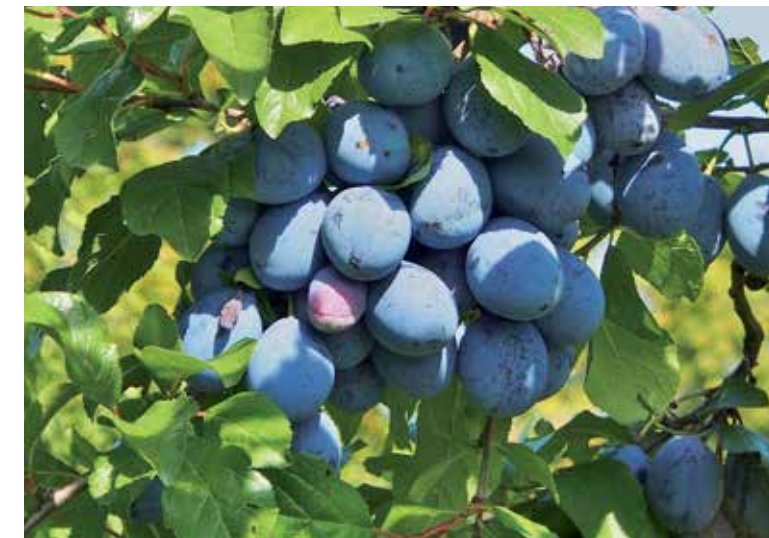
Slivky sú chutné a plné vitamínov.

Slivky pred sušením umyjeme pod tečúcou vodou, následne ich narežeme nožom a vyberieme z nich kôstky. Sušiť ich môžeme v elektrickej rúre tak, že plech vystelieme papierom na pečenie a rovnomerne naň poukladáme pripravené slivky. Jednotlivé kusy by sa