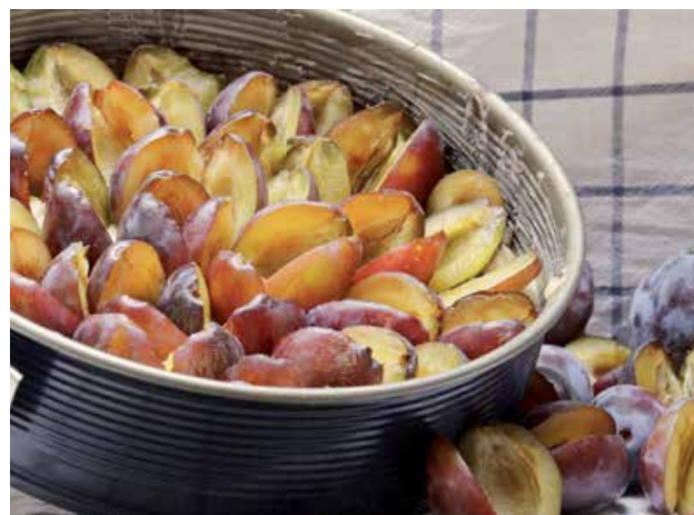
Slivkové koláče sú veľmi obľúbené.

Suroviny: 125 g maslo, 250 g hladká múka, 1 ks vajce, 80 g kryštálový cukor, 1 vanilínový cukor, 1 ČL prášok do pečiva, slivky