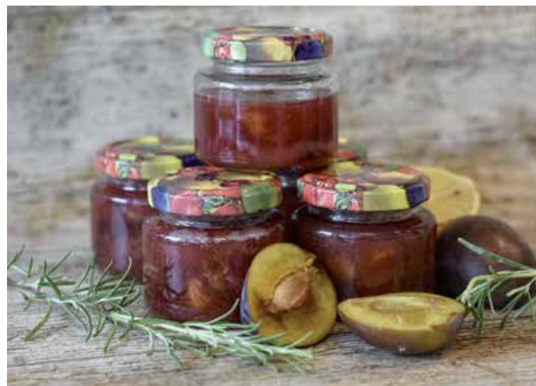
Slivky sú vhodné na výrobu domácich džemov a lekvárov.

šime na 60 °C. Treba myslieť na to, že slivky budú počas sušenia púšťať šťavu, ktorá sa bude odparovať. Dvierka na rúre by preto mali byť pootvorené.