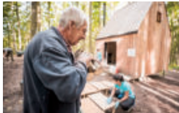
» ren

Útulňa Jozefa Maka bola verejnosti sprístupnená v júni 2023 a slúži tiež diaľkovým turistom prechádzajúcim cez Malé Karpaty po Ceste hrdinov SNP.