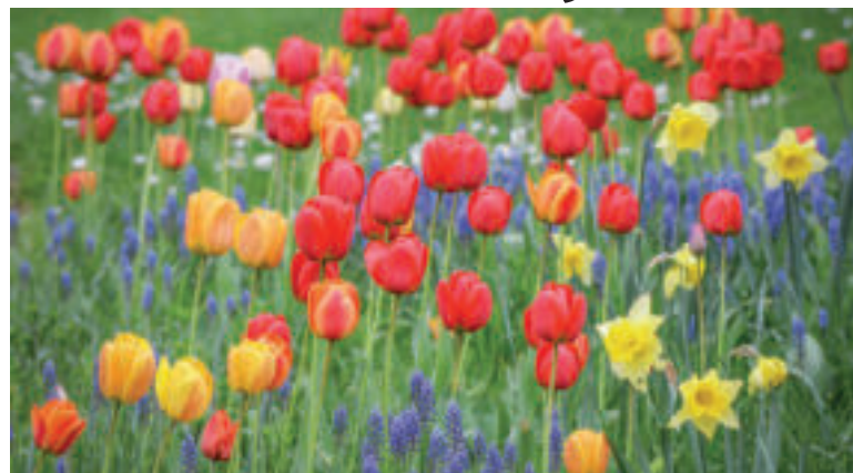
Cibuľoviny sa vám už na jar odvdčia svojou krásou.