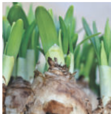
Je čas na výsadbu cibuľovín.